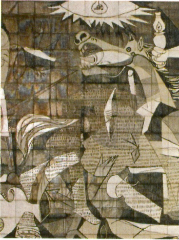
Detail aus Picassos Guernica

Bilbao. Abendessen und Übernachtung in Bilbao.