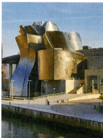
Guggenheim-Museum in Bilbao

Frühstück im Hotel. Heute fahren wir zunächst entlang der baskischen Küste, über Zarautz, Getaria und Zumaia, wo wir am Strand von Itzurun spektakuläre Steilküsten betrachten werden, weiter nach Vitoria-Gasteiz. Nach der Ankunft besichtigen wir die Hauptstadt des Baskenlands. In der Altstadt befindet sich die gotische Kathedrale Santa María, mit Skulpturen an der Fassade und erhöhten Säulen, die Türme bilden. Am Virgen Blanca Platz befindet sich das Denkmal zur Schlacht von Vitoria. Wir besuchen die Kirche von San Miguel. Sie hat ein grosses barockes Altarbild und eine Statue der Virgen Blanca, der Schutzheiligen der Stadt. Am Nachmittag fahren wir weiter nach