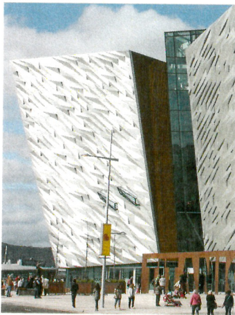
Titanic Museum in Belfast

Nordirlands. Ganz in der Nähe liegt die Bushmills Whiskey Destillery. Sie ist eine der ältesten Whiskeybrennereien der Welt mit einer mehr als 400-jährigen Tradition. Die nachmittägliche Whiskeyprobe ist natürlich mit einem vorherigen Rundgang durch die Brennerei verbunden. Weiterfahrt nach Belfast.