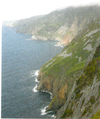
An der Küste: Slieve League